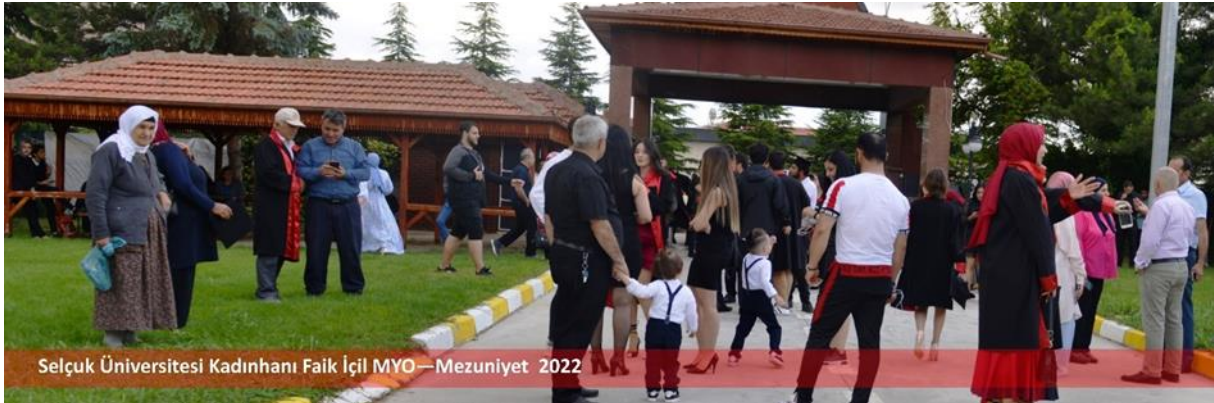
Selçuk Üniversitesi Kadınhanı Faik İçil MYO — Mezuniyet 2022