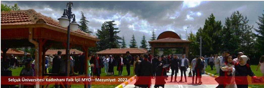
Selçuk Üniversitesi Kadınhanı Faik İçil MYO—Mezuniyet 2022